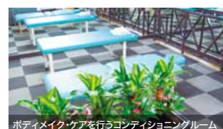
ボディメイク・ケアを行うコンディショニングルーム