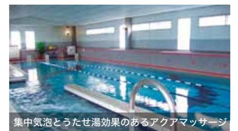
集中気泡とうたせ湯効果のあるアクアマッサージ