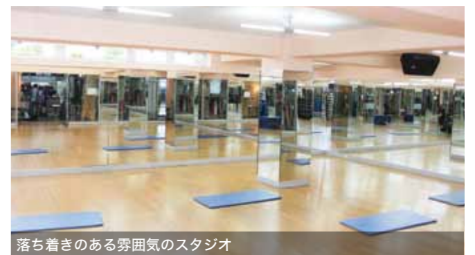
落ち着きのある雰囲気スタジオ