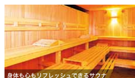
身体も心もリフレッシュできるサウナ