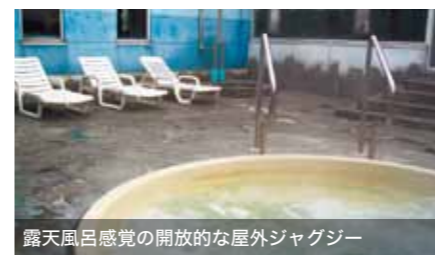
露天風呂感覚の開放的な屋外ジャグジー