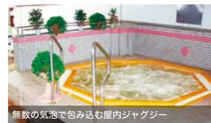
無数の気泡で包み込む屋内ジャグジー