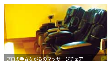
プロの手さながらのマッサージチェア