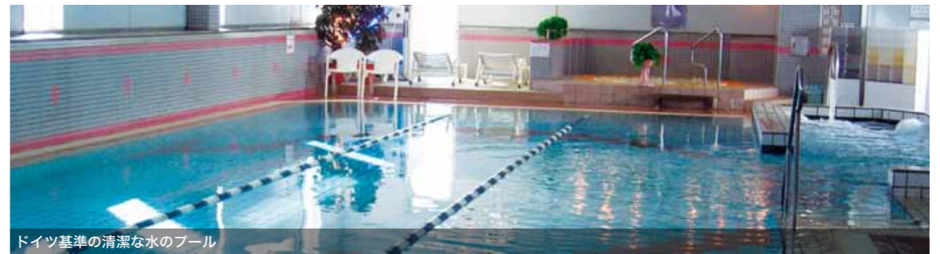
ドイツ基準の清潔な水のプール