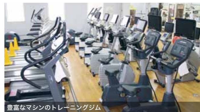
豊富なマシンのトレーニングジム